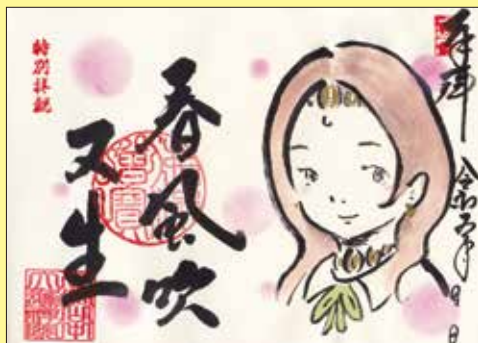
墨書き御朱印「春風吹又生」