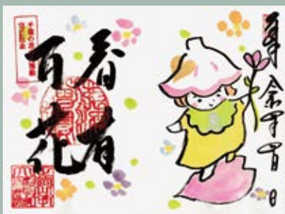
春の期間限定 記念御朱印「花あみちゃん」